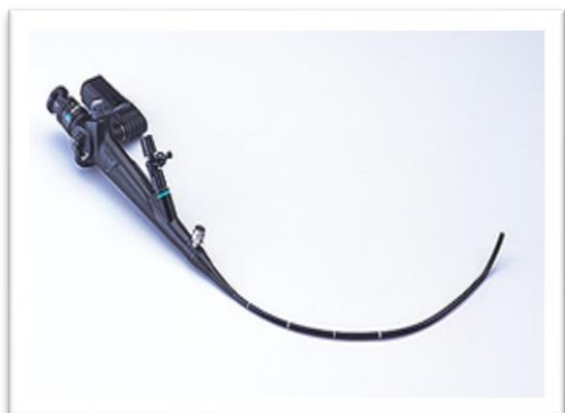
カメラの太さは直径 6mm 程になります