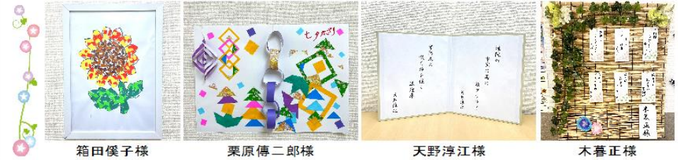
箱田優子様 栗原傳二郎様 天野淳江様 木暮正様