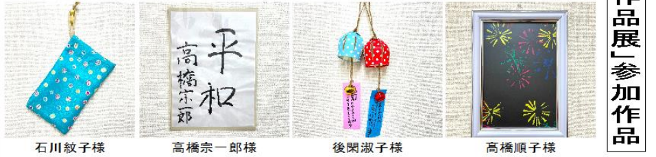
石川紋子様 高橋宗一郎様 後閑淑子様 高橋順子様